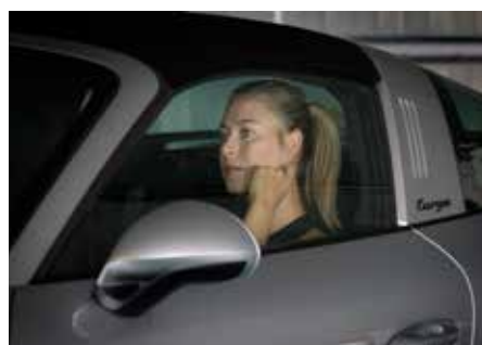
Maria Sharapova als Porsche-Markenbotschafterin